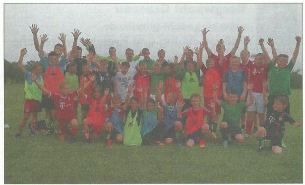
Das Demo Training machte sichtlich Eindruck bei Trainern und Spielern, daher werden wir diese Fortbildungsmöglichkeit in Zukunft sicherlich wiederholen.

Am 11. Juli haben die TSV Jugendtrainer und Interessierte an einer Fortbildung des deutschen Fußballbundes teilgenommen. Das DFB Mobil kam zum Marquartsteiner Sportplatz und zwei DFB Trainer führten mit unseren Jungs ein Demo Training durch. Die DFB Trainer hatten viele nützliche Tipps für uns im Gepäck, die wir für die neue Trainingssaison einsetzen können.